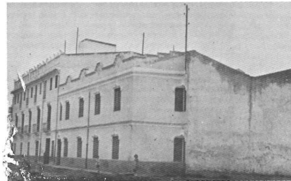
Parte del edificio testigo de las primeras actividades de nuestras Hermanas.

ciéndoles llegada la hora la adquirieron, y enseguida comenzaron a practicar diligencias para adquirir otra. A Dios rogando y con el mazo dando, sin blanca en el bolsillo, entre temores y contra- tiempos de mil maneras, pero favorecidas de algunas personas que les prestaron el dinero necesario por un módico interés, compraron primero una casa situada frente a la Iglesia Parroquial, firmándose la escritura el día de la Virgen de los Dolores del mismo año, y después otras dos contiguas a ésta cuya escritura lleva fecha 9 de Septiembre de 1911". (7).