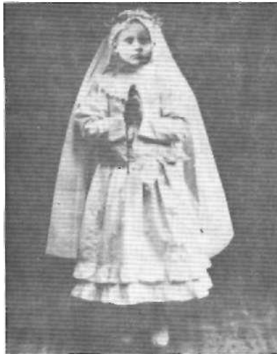
Su primer encuentro con Jes3s la marc3 para una mayor entrega.

A los once años hizo su Primera Comuni3n.