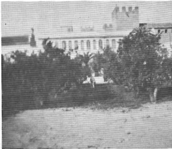
En 1.923 el huerto pasa a ser propiedad de la Comunidad.